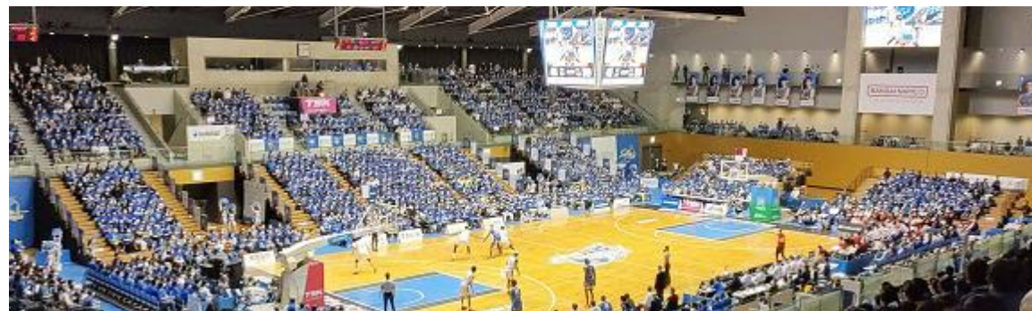
【現状と新B1入会基準】