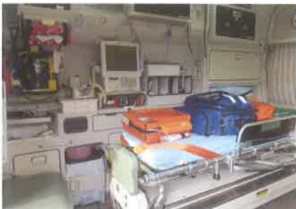
高規格救急自動車内部

救急救命士による高度な救急医療に対応できる最新の救急医療機器を装備するとともに、救助活動にも迅速適確に対応できるよう、サイド収納ボックスに4点のレスキューセットを積載した四輪駆動の救急車です。