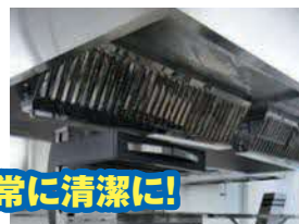
厨房設備は常に清潔に!

清掃、必要な点検及び整備など厨房設備の維持管理は「火災予防条例」で義務づけられています。