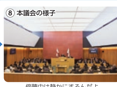
8 本議会の様子 傍聴中は静かにするんだよ