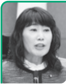
たちばな ふみ (共産党市議員)