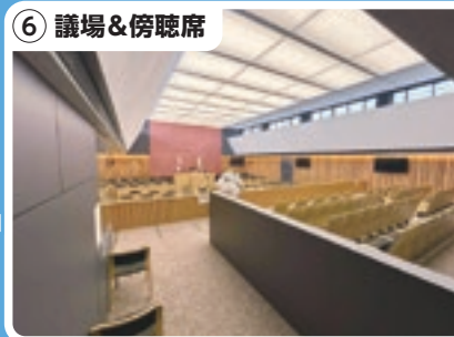
6 議場&傍聴席 入るとこんな感じだよ！