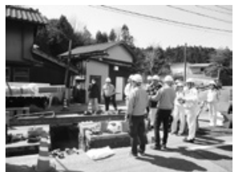
工事現場で説明を受ける【古志ポンプ場】