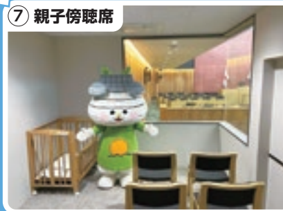
7 親子傍聴席 安心して聴けるね