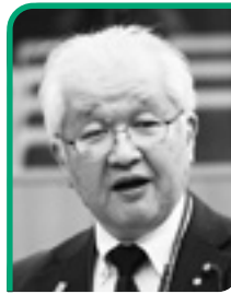
にしおおり のぶゆき 錦織 伸行 (会派に属しない議員)

おもじろ釜は玉造温泉街から少し離れており、初めて訪れる方には分かりにくいと感じられる面もある。今後温泉街からの誘導看板の整備を検討するとともに、現地に設置している説明看板の内容を分かりやすく見直すなど、環境整備に取り組み、周辺観光案内看板の設置も検討していく。