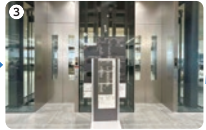
3 エレベーターから5Fへ