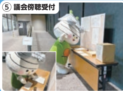
5 議会傍聴受付 受付票を書くんだね