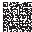
令和8年2月議会 補正予算