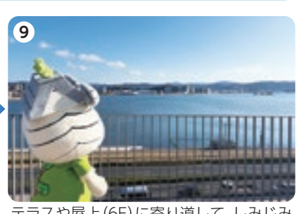
9 テラスや屋上(6F)に寄り道して、しみじみ