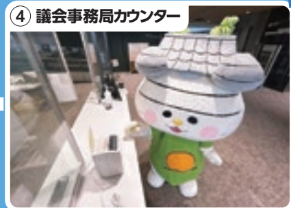
4 議会事務局カウンター ここで駐車券の認証処理ができるよ