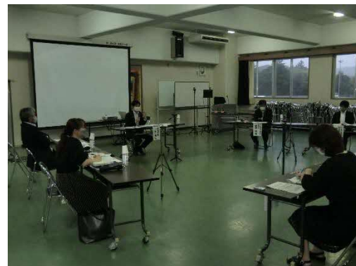
第2回総合教育会議

令和3年度は3回開催し、第1回（R3.7.6）では義務教育学校玉湯学園におけるICT機器を活用した授業やふるさと教育の授業の視察及び今後の松江市の取組に関する意見交換、第2回（R3.10.12）では皆美が丘女子高校における授業の様子視察及び皆美が丘女子高校の魅力化に関する意見交換、第3回（R4.3.23）では教育大綱の改定に向けた協議を行いました。