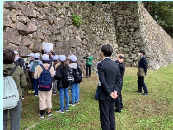
第1回総合教育会議

令和4年度は2回開催し、第1回（R4.11.1及びR4.11.4）では古江小学校の松江城授業の現地見学授業及びふりかえり授業の視察及び意見交換、第2回（R5.1.17）では第一中学校におけるICT機器を活用した授業の視察及び意見交換を行いました。