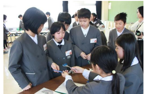
【参考】持田小での「いきいきゲーム」の様子