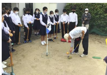
グランドゴルフサークルに インタビュー&体験(城北公)