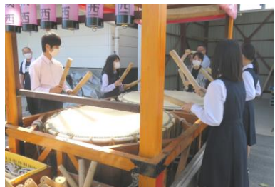
繋(どう)サークルに インタビュー&体験(城西公)

・訪問を終えて、公民館は、また来たくような素敵なおとこだと思いました。公民館に繋があること自体に驚きました。私は、小学校三年生のときに一回体験したことがあったけれど、中学生目線で改めて繋を体験して、プロの迫力というものがよくわかりました。 ・今回のグランドゴルフ体験をする中で、高齢者に視点をおいて公民館の役割を考えてみたけれど、公民館はとても楽しめる場であると思いました。公民館があることは、利用者の方の生きがいにもつながっているのではないかと考えました。