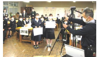
中学生の提案発表