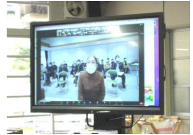
公民館とリモート交流