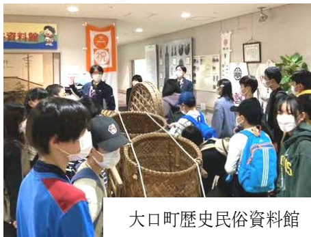
大口町歴史民俗資料館