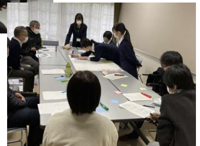
中学生&高校生 &地域の大人の意見交換