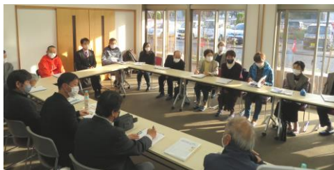
たまめん&T-ails と古江地区の交流