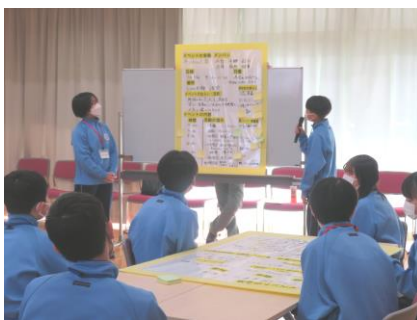
1日練り上げた企画を全体に発表