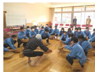
昼イベントみんなで「どじょうすくい男踊り」