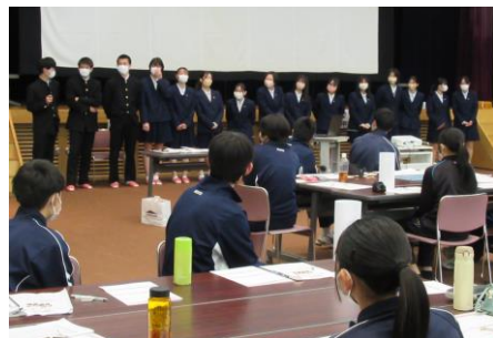
たくさんの高校生が参加してくれました