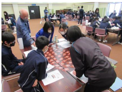
たい焼きカードでお互いをもっと知る