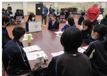
高校生と中学生の対話 高校生はたくさんのことを経験していました