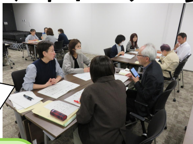
情報交換会の様子