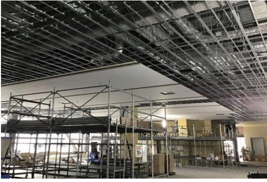
天井を造っています。