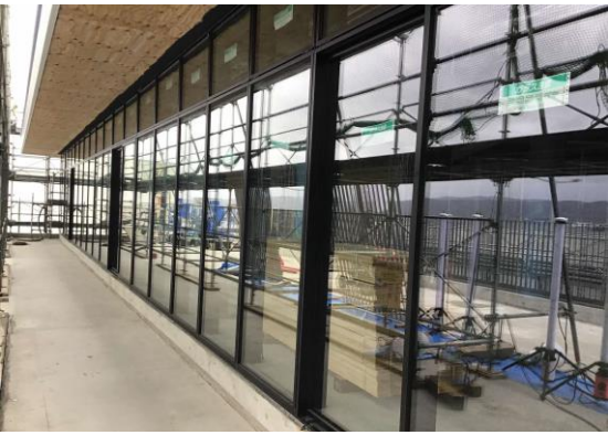
テラス側の窓の取付を行いました。