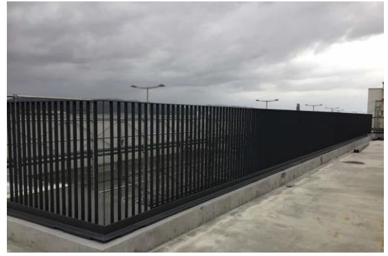
テラスの手すりが完成しました。