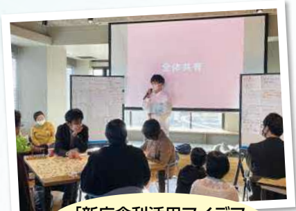
「新庁舎利活用アイデア会議」の様子

令和5年度は、新庁舎の利活用を希望する民間事業者などを募り、実際に新庁舎の一部を使用してもらいながら、賑わい創出に向けた新庁舎の運用方法を検証する「新庁舎みんなのトライアル」を実施します。