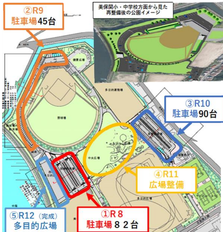
図 再整備の内容と実施年度