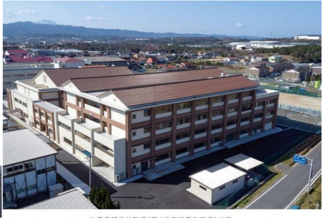
出雲養護学校整備(第4教育棟電気設備)工事