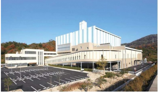
松江市新ごみ処理施設建設工事