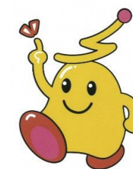
三和電気イメージキャラクター エレピー君