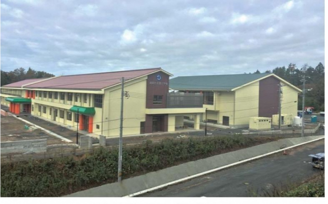
旭統合小学校校舎建設に伴う電気設備工事