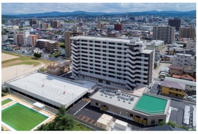
島根県営住宅((仮称)松江市大輪団地)建設(電気設備)工事