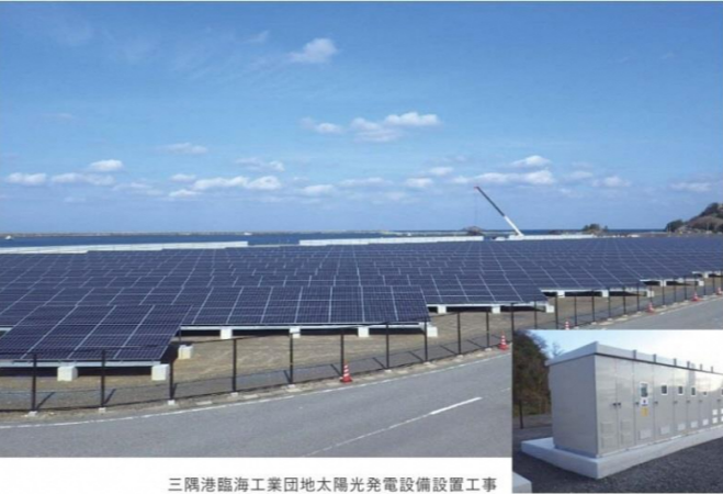
三隅港臨海工業団地太陽光発電設備設置工事