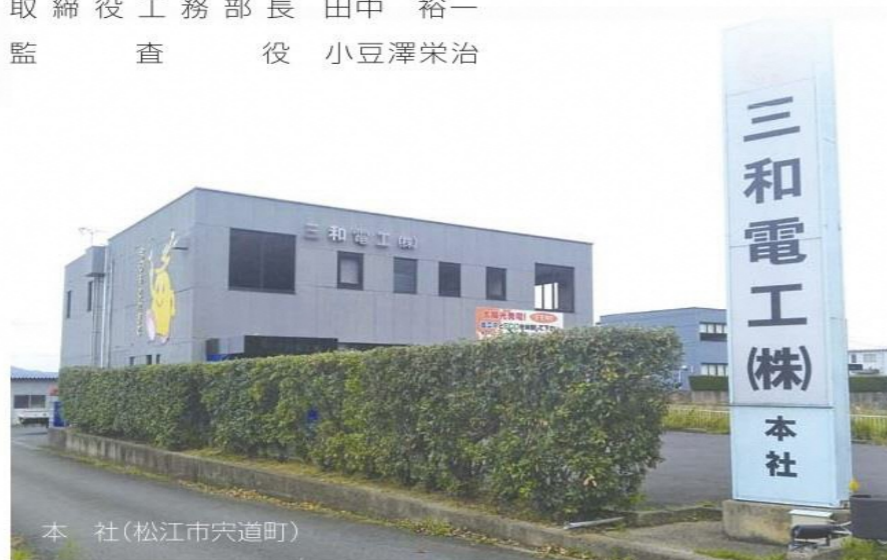
本社(松江市宍道町)