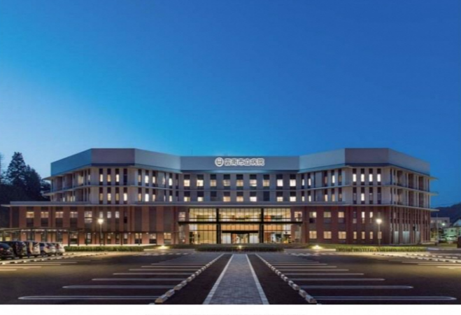
雲南市立病院建設工事(電気設備)