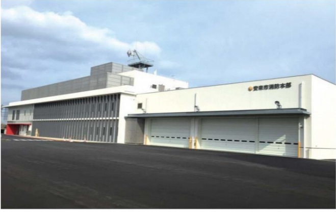
安来市消防庁舎新築工事(電気設備)