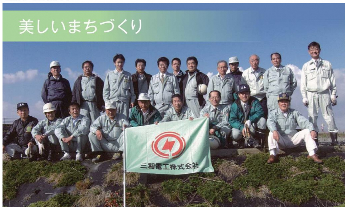
第1回活動 平成19年度11月17日