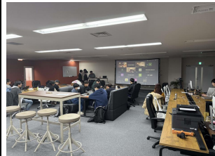
エンジニアと地元事業家によるハッカソン コンテストの立ち上げ