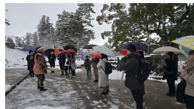
▲おもてなし(人材育成)研修