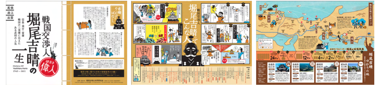
<製作したパンフレット>

【配布先】 全国山城サミット（安来市にて9月開催） お城EXP02018（横浜市にて12月開催） 松江城、富田城、松江歴史館、大口市歴史民俗資料館にパンフレットを設置しPR活動に活用した。