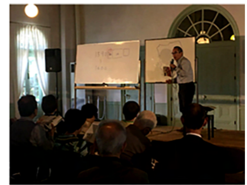
<中間報告会の様子>