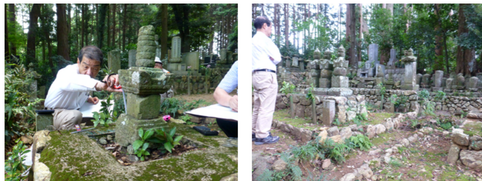
<龍潭寺にて石塔調査>