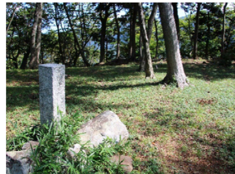
<国吉城・本丸の石碑>