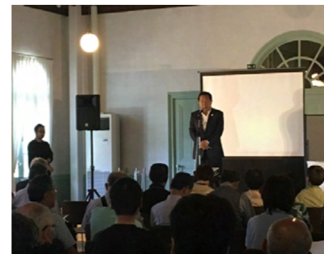
<鈴木大口市長の挨拶>