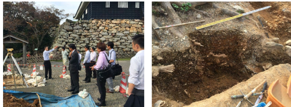
<浜松城にて発掘調査現場の視察>