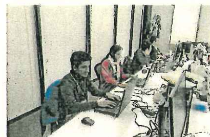
インドからのインターンシップ事業

市場拡大のほか、IT人材等の育成・確保などを旨し、インド(ケララ州)や台湾(台北市)との交流を強化していきます。