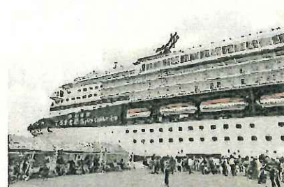
重要港湾・境港のクルーズ船寄港