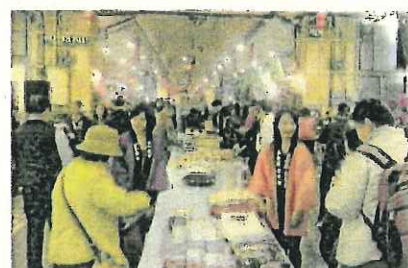
台北市「建国花市」での圏域の産業・観光PR