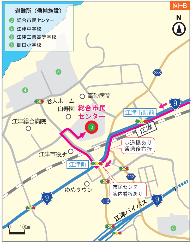
② 総合市民センター 砂子町・内中原町・片原町・末次町 芋町・西茶町・東茶町