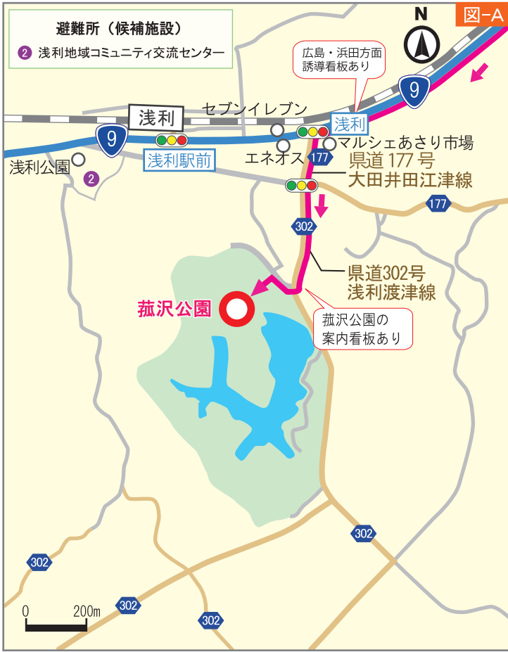
① 菰沢公園 千鳥町・堂形町