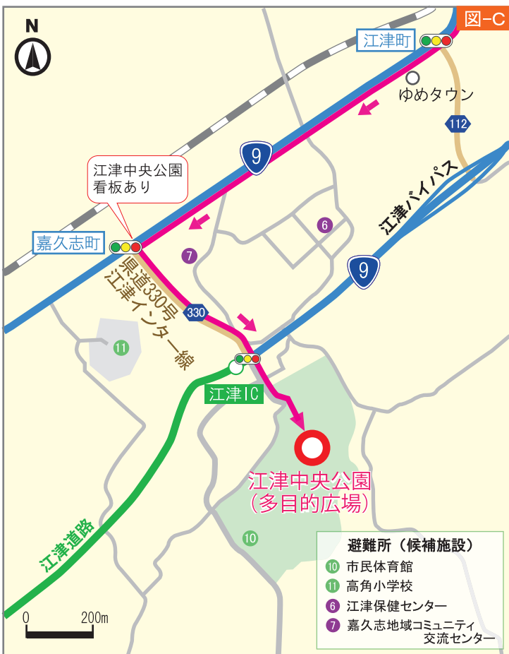
③ 江津中央公園（多目的広場） 南平台・国屋町・中原町