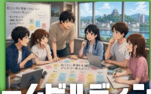
チームビルディング