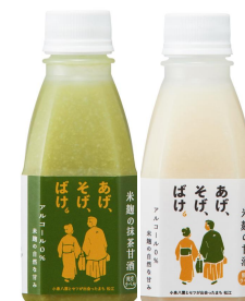
米麴甘酒 (スギナリ醸造所)