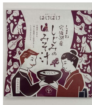
穴道湖産しじみ使用 即席みそ汁 (平野缶詰)