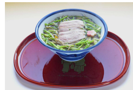
小泉八雲とセツも好んだ松江の冬の味覚 黒田せりの香る鴨せりそば (出雲そばきがる)