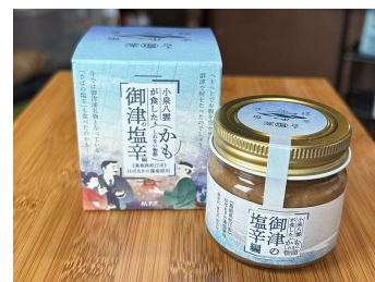
小泉八雲が食したかもしれない物語 御津の塩辛編 (M.F.F)