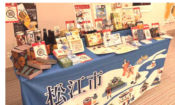
カラコロ工房でのブース出展 (3/23、24)