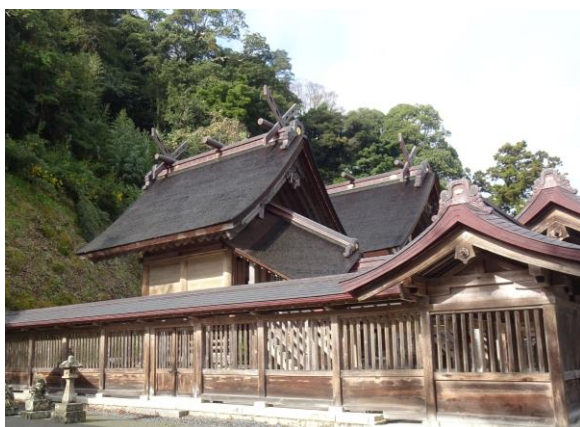
佐太神社 （左から南殿、正中殿）

こうして祭礼の形態や祭祀組織も荘園内での地域的なものから、広域的なものへと変化したことが推定されている。佐太神社が、神在祭で中心的な存在になったことや、佐陀神能が創作され、また出雲地方に広く出雲神楽として広まった理由は、神名火山を擁する神社であることに加えて、こうした歴史的な背景もあるものと考えられる。