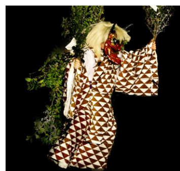
「八重垣」に登場する八岐大蛇は、 「立ち大蛇」と呼ばれる立ち姿で舞われる