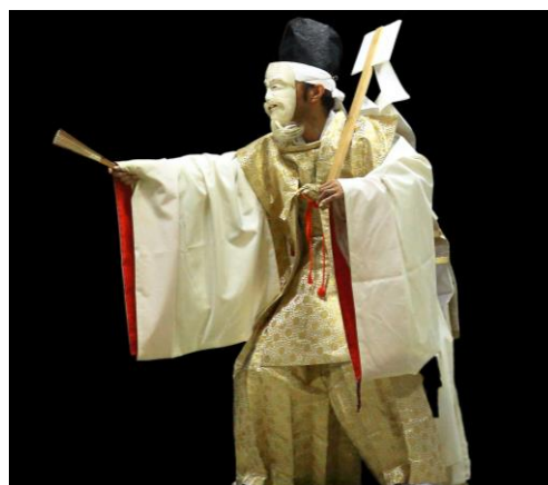
「大社」神社の縁起を説く