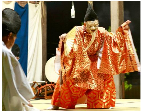
式三番（祝意を意図する舞）