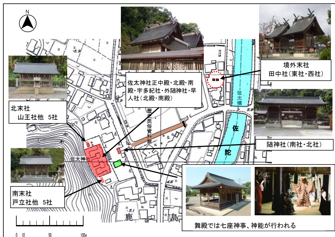
御座替神事と佐陀神能が行われる主な建造物等