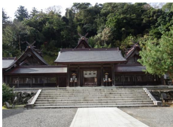
佐太神社遠景 （奥の本殿は左から南殿、正中殿、北殿）