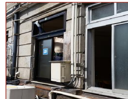
（左）取替後の建具（右）取替前の建具