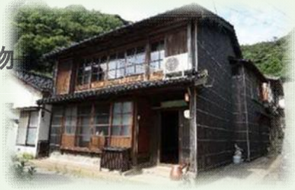
伝統的建造物の一例：濱延舎(旧濱中屋)