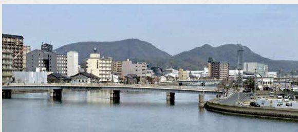
宍道湖大橋からみた嵩山（左）と和久羅山

山口の郷と手染の郷 山口郷は、スサノオノミコトの御子、ツルギヒコが布自枳美（ふじきみ）山（嵩山）に鎮座するにあたり、その登山口とした場所であり、手染（たしみ）郷はオオナムチノミコトが丁寧に造った国なので「たし」と呼ばれていたのが、訛って「たしみ」になったと『出雲国風土記』には書かれています。