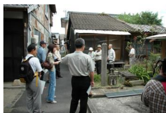
まち歩きワークショップ

平成 21 年度から、公民館区等の地域単位で、地域の文化財等の“お宝”を掘り起こしてまち歩きマップを作成する「わがまち自慢発掘プロジェクト」を実施している。実施にあたっては、各公民館区の市民メンバー