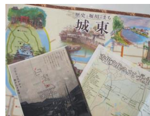
まち歩きマップの完成品

と、市の関係 7 課による庁内チームとの協働により作業を進めており、平成 22 年度は 9 公民館区で実施した。平成 23 年度以降も毎年 6～7 公民館区で実施し、平成 25 年度に全公民館区が終了した。