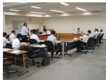
第1回策定委員会(7月2日)

平成22年5月に、学識経験者、観光関連団体、地域代表などの有識者による外部委員会「松江市歴史的風致維持向上計画策定委員会」を設置し、4回の会議を経て様々な意見・助言・指導を受け、計画（案）に反映させた。