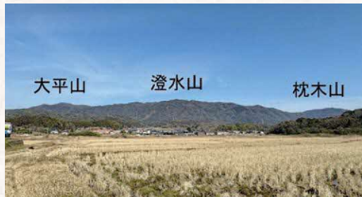
川原町から見た大倉山（枕木山）から小倉山（大平山）

闇見の地名の由来として、注目されるのは平石充氏の見解です。平石氏は、闇見国は「くら」の国ではないかと説きます。その主な根拠は、風土記の島根郡条に記載される山の名前です。島根郡条には、布自枳美高山と女嵩山