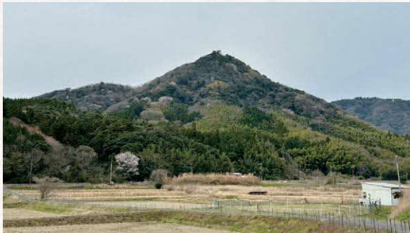
朝酌町から見た和久羅山

羽倉山は史料からみて、戦国時代にさかのぼる古い名です。また音の変化を考えると、白倉（はくくら、はくら）→羽倉（はくら、わくら）→和久羅（わくら）となるのが自然でしょう。となれば、白倉は戦国時代をさらにさかのぼる地名の可能性が出てくるのです。平石氏に導かれれば、島根郡の山の記載のはじまりは「白倉山」で、烽が設置された山だったため、「ふじきみ」の接頭語と「高山」という表象語で記されたと解釈できないでしょうか。