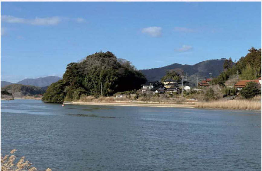
矢田の渡し南岸から見た和久羅山 中央左の小山には多賀神社が鎮座し、その向こうに6世紀後半の 松江北部の首長墓、魚見塚古墳があります。

和久羅山周辺は、いにしえより交通上の要衝でした。人や物の移動には、舟が最も便利だった古代には、宍道湖と中海の間をギュッとしばる朝酌地域は、交通・流通を掌握するために重要な地域でした。古墳時代には、西尾町に5世紀の大型古墳が築かれ、6世紀から7世紀には朝酌町に大型古墳や首長級の豪族が葬られる石棺式石室が築かれています。どちらも和久羅山の南麓です。風土記には、国府を基準とした水陸交通の要所として、「朝酌渡」が記され、その場所は後の矢田渡しとほぼ同じところです。役所としての朝酌渡（渡し場の管理事務所的役割）は、南岸側にありました。矢田渡しの南側から北を望むと、和久羅山がそびえていますが、嵩山はその陰に隠れてみることはできません。交通の要衝を上から監視する機能が、古代からあったと考えるのは自然です。出雲のヘソともいべき渡をにらむ和久羅山が、烽を選ぶときに真っ先に思い浮かんだとは考えられないでしょうか。