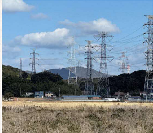
史跡出雲国府跡 十字衝推定地から見た 嵩山（右）と和久羅山（影になっている山）

布自枳美高山には「烽あり」と記されています。古代に、特に対外的な軍事情報を伝えるために、山陰道には狼煙（のろし）台である烽（とぶひ）が点々と置かれました。出雲国風土記には国内に五か所の烽が設置されたことが記され、布自枳美高山はその立地から、出雲国庁・意宇軍団に情報を届けるハブの山だったと考えられます。嵩山と和久羅山は、北山の南に突