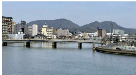
宍道湖西岸（出雲市園町）から見た嵩山（左）と和久羅山 和久羅山頂部の凹凸が人の顔に、嵩山の緩やかな膨らみが 体に見えます

松江市の市街地は、南北と東側を山で囲まれています。そのなかでも、シンボリックで市民がよく知る山として、嵩山（だけさん）と和久羅山（わくらさん）があります。西から見ると、和久羅山が人物の顔、嵩山が胸からお腹あたりに見えることから、以前は「寝仏山」と言われてもいたそうです。見る人によっては、麗しき乙女の寝姿と形容されてもいました。