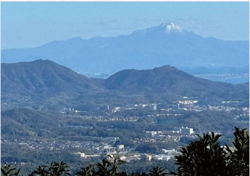
朝日山から見た和久羅山と大山