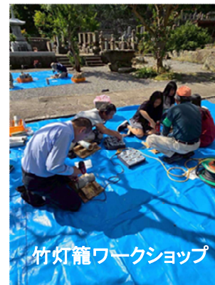
竹灯籠ワークショップ