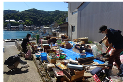
8月30日 お片付けし隊(空き家清掃活動)