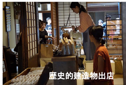
歴史的建造物出店