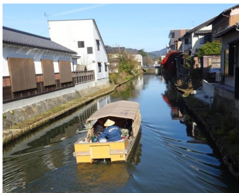
堀川を周遊する「堀川遊覧船」

地域住民の堀川に対する愛着・愛護の心は当時から変わることはなく、毎年この時期になると、自主的に堀川端の植栽の剪定が行われ、日常においても清掃活動が続けられ、また、主に「堀川遊覧船」の船頭たちの手によっては、石垣の無い堀の土手などに「紫陽花」や「彼岸花」、「水仙」などの季節の花が植えられるなど、住民や関係者の努力によって、堀川の水際の環境と良好な景観が保全されている。この堀川を船で巡る「堀川遊覧船」（平成9年（1997）就航開始）は、松江を代表する観光スポットとして、年間約30万人の観光客が利用し、堀川から眺める城下町風情を楽しんでいる。