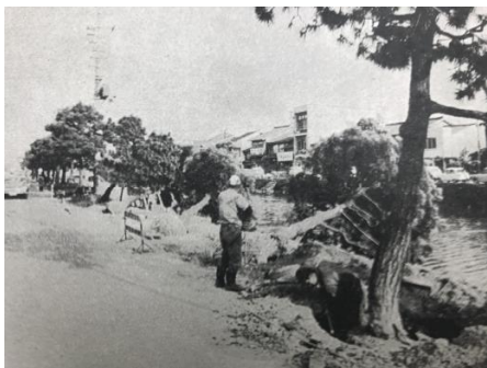
京橋川の一部埋め立てに伴う松の移植 昭和44年（1969）5月1日発行広報まつえ

議論の結果として、昭和44年（1969）、京橋川（松江城南側外堀）は、交通緩和策のひとつとして一部埋め立てによる北側道路の拡幅が実施された。「京橋川の松」と呼ばれて市民に親しまれた堀端の松並木は拡幅後の歩道に移植され、昔ながらの風情は守られつつ、近代化するまちなみと堀川の風情が相まった新たな景観が形成されることとなった。