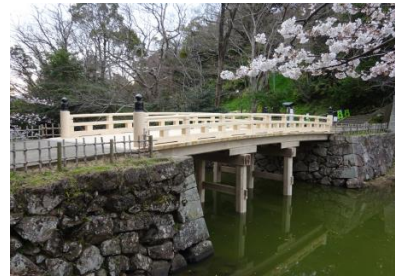
ちどりばし 千鳥橋（松江城南側内堀）