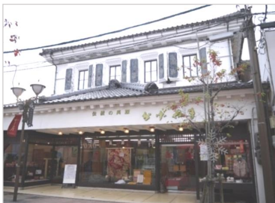
かげやま呉服店 (旧第三国立銀行松江支店)

市内の銀行建築としては最も古いものであり、明治期からの地域の歴史を語るうえで貴重な建物とされる。現在は呉服店として営業し松江の風情を引き立てている。平成28年度（2016）に松江市歴史的建造物の保全継承及び活用の推進に関する条例に基づく松江市登録歴史的建造物に登録されている。