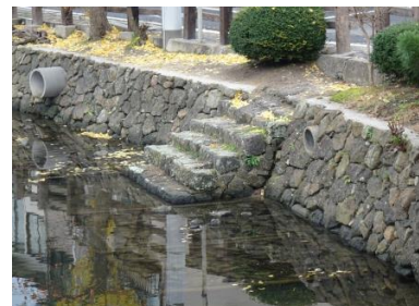
「灘」京橋川の筋違橋付近 町人町での物資の積み下ろしに使われた