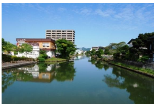
しじゅうけんぼりがわ 四十間堀川（松江城西側外堀）

南側の外堀「京橋川」と東側の外堀「米子川」は、武家地と町人地を分かちように掘られた堀である。このうち「京橋川」は、西側は四十間堀に接し、東側は宍道湖に抜けるように造られていた。元禄2年（1689）に四十間堀が宍道湖と繋がるまでは、この京橋川の東端だけが宍道湖に繋がる唯一の入口であり、京橋川の南側は職人町や商人町であったことから、舟による物資の流通上も重要な川として機能してきた。このため、京橋川は江戸時代の早い時期から両側を石垣で護岸され、舟着き場も設置されていた。