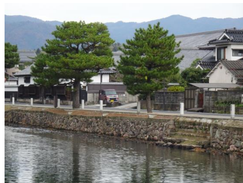
松江城東側の内堀 石垣の護岸と「灘」（石段）