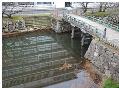
「灘」松江城南側千鳥橋南詰