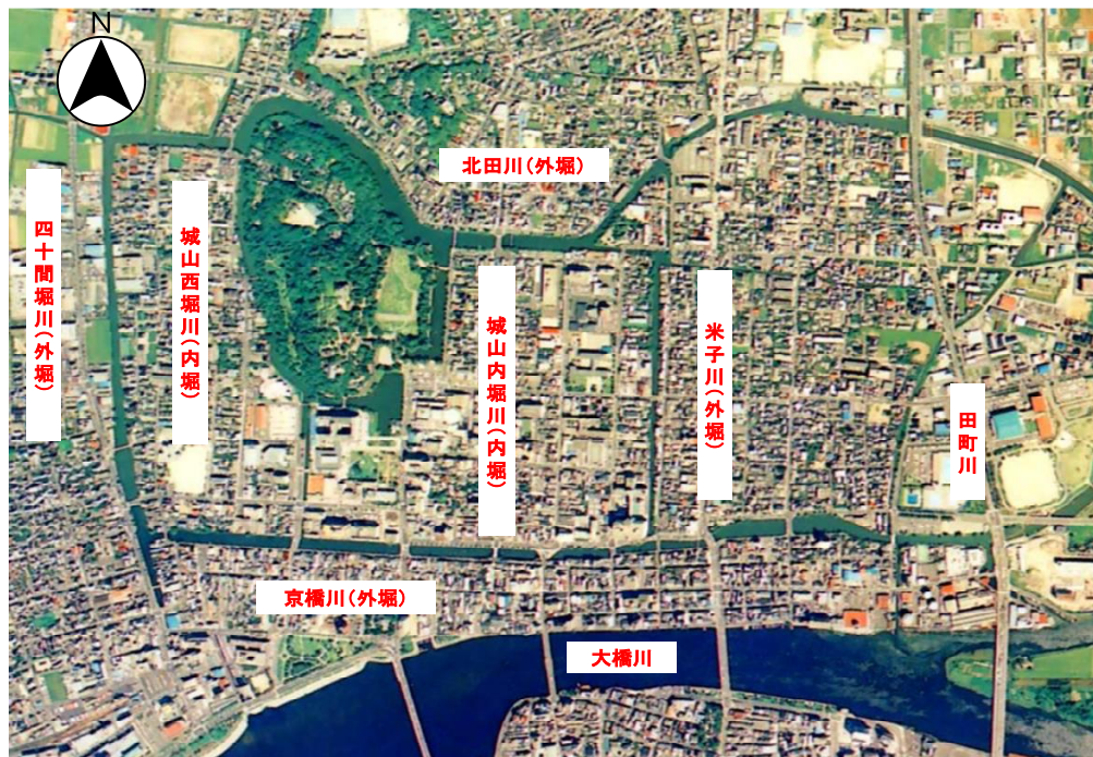
松江城下町の掘割