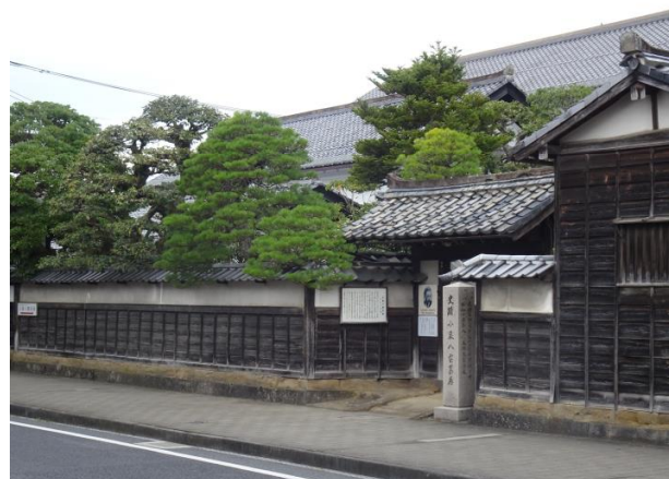
史跡小泉八雲旧居

松江城の北側の堀川沿いにあり塩見畷通りに面している。「堀川」をはじめとする松江の自然景観や文化を文筆で世界に紹介した小泉八雲（ラフカディオ・ハーン）がセツ夫人とともに、明治24年（1891）6月から11月まで住んだ家である。居間から三方向の庭を眺められる旧士族の屋敷で、代々根岸家のものを根岸氏の不在時に八雲が借りて住まいした場所であった。昭和15年（1940）に史跡指定を受けた。