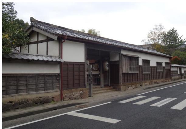
塩見畷旧武家屋敷遺構（市指定有形文化財）

松江城の北側の堀川沿いにあり塩見畷通りに面している。遺構の1棟は現在「武家屋敷」として公開されている長屋門で、もう1棟は現在「田部美術館」のある長屋門である。長屋門は、武家屋敷の特徴の一つで、門番や中間（武家奉公人）が詰め、出入りする人の監視や案内などの雑務にあたったとされる。いずれの長屋門も平屋切妻造で屋根は棧瓦葺である。