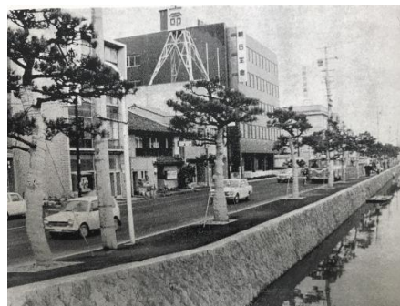
京橋川北側道路完成後の堀川の景観 昭和45年（1970）2月1日発行広報まつえ