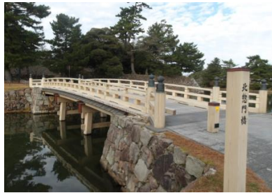
きたそうもんばし 北惣門橋（松江城東側内堀）

時代の推移と町の発展につれて橋の数も多くなり、現在では50箇所を越える橋が架けられている。松江城東側の内堀にある「北惣門橋」や松江城南側の内堀にある「千鳥橋」は、木造で復元されており、往時の風情を漂わせている。橋の多くは改修されつつも現在も町的生活道路上に位置して松江の交通を支えているとともに、堀川の風景が橋を渡る人々を楽しませている。