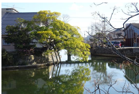
しじゅうけんぼりがわ きょうばしがわ 四十間堀川と京橋川の結節地点