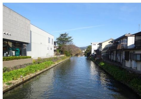
よなごがわ 米子川（松江城東側外堀）