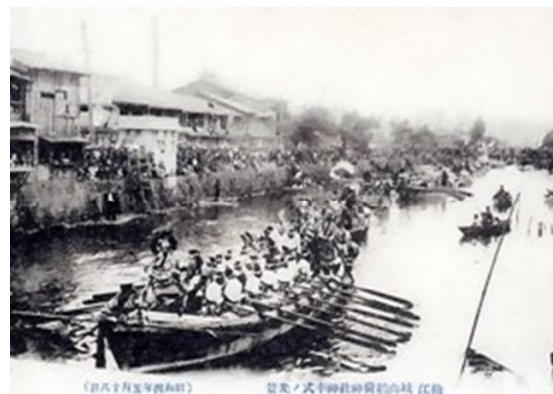
昭和4年（1929）のホーランエンヤ