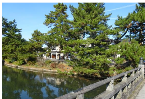
松江城北側の内堀 土羽（土手）の護岸

内堀の護岸の特徴として、亀田山の北側と西側を巡る堀は両岸の護岸が土羽（土手）であるのに対して、東側は石垣の護岸になっている点が挙げられる。これは松江城が特に南東方面からの敵の進入を想定して縄張りされていることや、城郭東側の二之丸下ノ段には米蔵が置かれ、物資を運搬する舟が接岸しやすいように配慮されたものと考えられる。荷揚げに使われた「灘」と呼ばれる石段が今でも内堀に残っており、往時の様子がしのばれる。