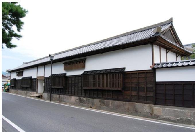
松江藩家老朝日家長屋（市指定有形文化財）

松江城の東側、北殿町の内堀沿いにある。江戸時代には家老屋敷が配置され、藩主が松平家になると、乙部、朝日、有澤、脇坂、柳田の代々家老5家が広大な敷地を占めていた。「松江藩家老朝日家長屋」は、松江城に面した朝日家の広大な屋敷地を囲む堀の役割も果たしていた。