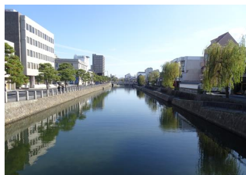
きょうばしがわ 京橋川（松江城南側外堀）