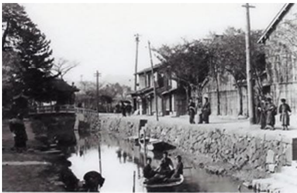
明治末～昭和初期（1910～1930 ころ）の堀川の風景

このように、松江の城下町が形成されて以来、堀川と人々の生活には密接な繋がりがあり、人々は暮らしを守るため、またはその貴重な機能を日常的に活用するためにも、様々な保全・愛護に努めてきたのである。