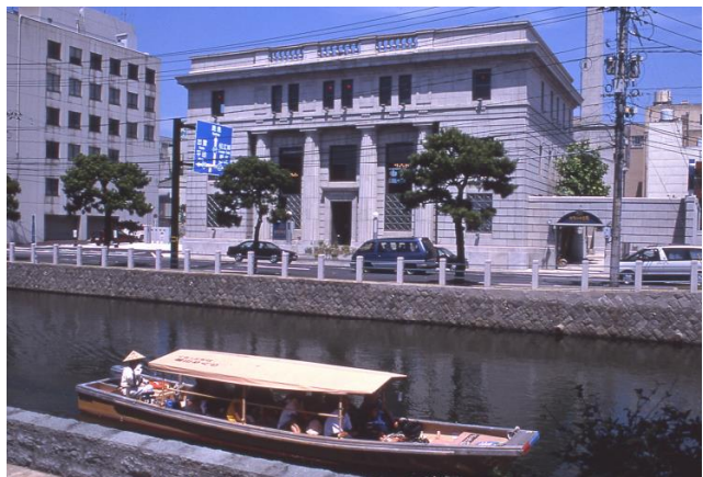
カラコロ工房（旧日本銀行松江支店） （登録有形文化財）

平成28年（2016）2月25日に登録有形文化財（建造物）に登録。現在は、市街地のランドマークとして市民が集う場となり、まち歩きや堀川遊覧船での観光拠点として利用されている。