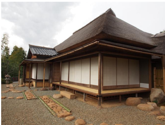
向月亭（重要文化財建造物）

茅葺屋根に柿葺の庇が付く。内部は4畳半台目（畳4枚半の客座と、約4分の3畳の点前座で構成された茶席のこと）、二方に入側と細い竹を並べた竹縁が廻る。台目床は落天井とし、内切りの炉で、床脇には一間の地袋と天袋が付く。全体的に調和がとれた秀明な茶室である。向月亭前の砂庭は、延段と飛石を配しただけのシンプルな造りで、その先に続く生垣と大刈込と、更に松江城下の豊かな眺望へと導く仕掛けになっている。