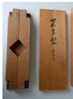
老舗和菓子店「一力堂」に伝わる御用達箱（献上菓子の容器）とお留め菓子の型

和菓子職人に継承される伝統技術は、市内で開催される多くの茶会の存在が源にある。松江城大茶会をはじめ季節ごとの流派の茶会においては、各流派からの要望を職人自身の感性で形にする必要があり、そこで培われた季節感のある造形美、柔らかく品の良い味わいなどが松江銘菓から上生菓子、新商品創作に至る様々な場面で表現されることになるのである。また、会社の垣根を越えた技術研鑽の場・組織として「松江松和会」があり、職人たちは松江銘菓の復興や技術の向上を図り、松江の伝統産業の継承と発展に努めている。