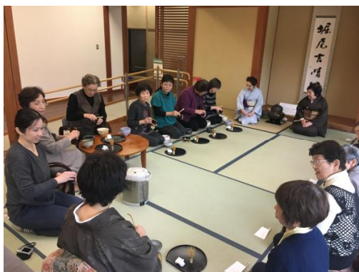
不昧公200年祭 市民向け講座の様子

これらの顕彰事業は、時の流れのなかで茶の湯も改革されるものと考え、新しい時代の茶の湯文化を築き発展させた不昧の精神を、現代に生きる市民が受け継ぎ、更なる自己研鑽をつみ、内容を豊かにし、未来につづく継承者を育成し、新たな松江の茶の湯文化を国内外に発信することを目指して、今日までつづけられてきたものである。