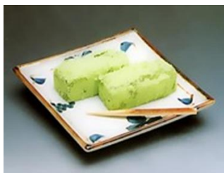
わか くさ 若 草