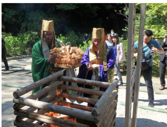
供養塔で焚いた火のなかに 使い古した茶釜を投げ入れて供養する