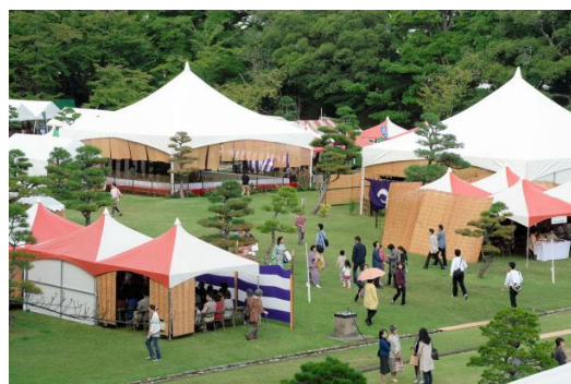
松江城大茶会 松江城二の丸下の段