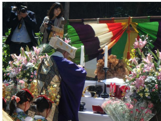
住職がお香を焚いて法語を唱える