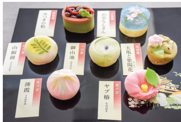
不昧公200年祭 記念菓子「不昧菓」