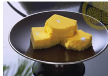
なたわ きと 菜種の里

不味は茶道に欠かせないものとして和菓子にも力を入れ、江戸の「越後屋」「伊勢屋」とともに、松江の「三津屋」と「面高屋」を御用菓子司とした。