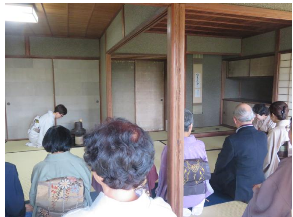
向月亭での茶会の様子