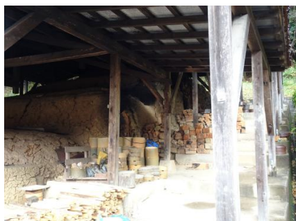
楽山焼 登り窯と燃料の赤松

現在でも江戸時代の登り窯（幅約6m長さ約12m）を修復しながら用いて作品を制作し、原料となる土は、初代のころから萩土に鉄分を多く含む地元乃木地区の土を混ぜあわせて調整し、「水簸」という方法（土を水中で大きさの違う粒子群に分ける）で粒子のそろった粘土にし、赤松の薪を使って焼成具合を微妙に調整するなど、伝統的な技法を守っている。平成12年（2000）11代長岡住右衛門空権のときに、楽山焼が島根県指定無形文化財（工芸技術）に指定され、同人が保持者として認定されたが、令和3年（2021）年に保持者の死去に伴い指定が解除された。