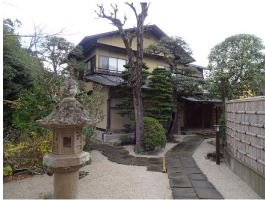
あかやま 赤山茶道会館 各流派や市民の茶の湯活動拠点