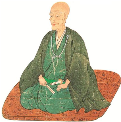
松江藩松平家7代藩主松平治郷（不昧） （松江月照寺蔵）