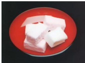
やま かわ 山 川