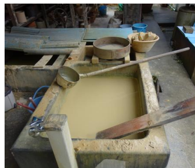
楽山焼 「水簸」という粘土づくりの様子