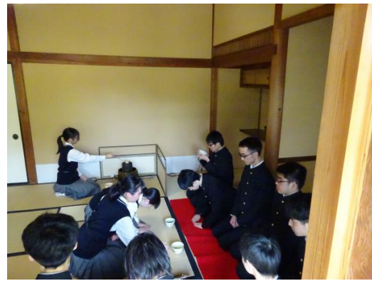
あかやま 赤山茶道会館 高校生の体験学習の様子