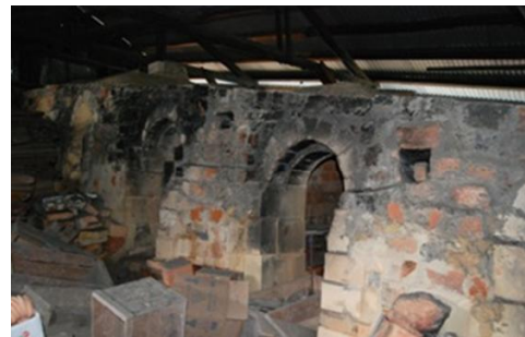
布志名焼（湯町窯）の登り窯