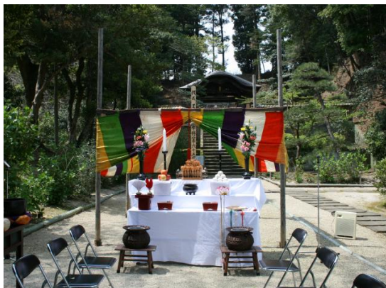
松江藩主松平家墓所 7代治郷廟所前の祭壇