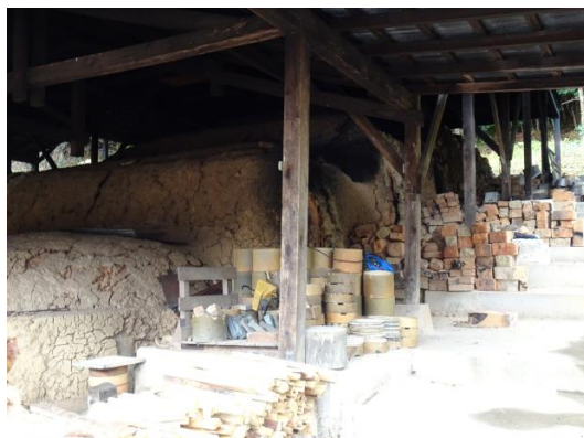
令和元年（2019）の登り窯 手前から2段目以降の3室は江戸時代からの形をとどめ、現在でも使われている