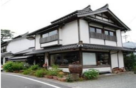
布志名焼の窯元（湯町窯）

明治以降は、柳宗悦やバーナード・リーチなどの民藝運動の指導者に影響を受け新しい作品づくりも展開し、現在に残る窯は、「土屋窯」の流れを汲む「雲善窯」と、民窯系の「湯町窯」、「船木窯」であり、「雲善窯」は茶陶器を中心に、「湯町窯」と「船木窯」は生活器などを中心として活動している。