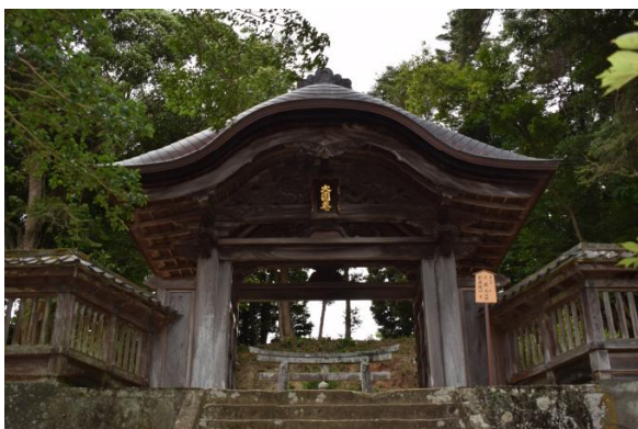
大圓庵（松平治郷）廟門 （島根県指定有形文化財）