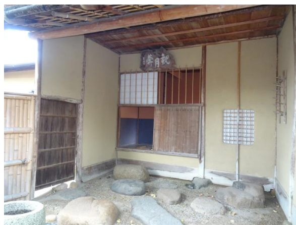
かんげつあん 観月庵（市指定有形文化財）