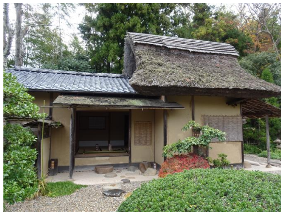
めいめいあん 明々庵（島根県指定有形文化財）