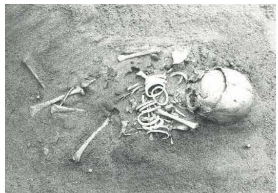
2号人骨。右手に6個、左手に8個のハイガイ製貝輪をつける

また、貝製のビーズも見つかっています。28号人骨(2～4歳)の周囲からみつかった2396個の貝小玉は、直径2～3ミリ、厚さ1ミリ前後の小さなものです。展示では便宜上ネックレスにしていますが、出土状況から衣服に縫いつけられていたものと想定されています。スパンコールのように輝いていたことでしょう。