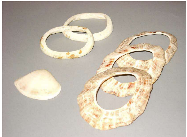
29号人骨が身につけていた貝輪。左奥ハイガイ製、右オオツタノハ

材料を入手し自分たちで貝輪をつくったのか、それとも製品として貝輪を手に入れたのでしょうか。子どもたちは普段から貝輪を身につけて暮らしていたのか、それとも死出の旅への装いだったのでしょうか。