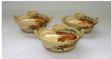
黄釉海老図把手付蓋茶碗