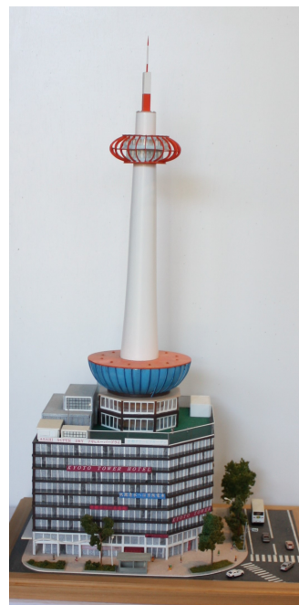
Kyoto tower hotel