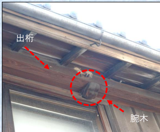
屋根外観【左棧瓦・来待石製の棟石】