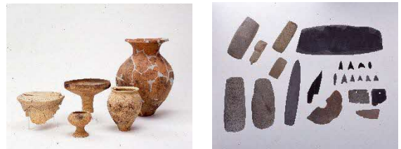
田和山遺跡出土土器・石製品