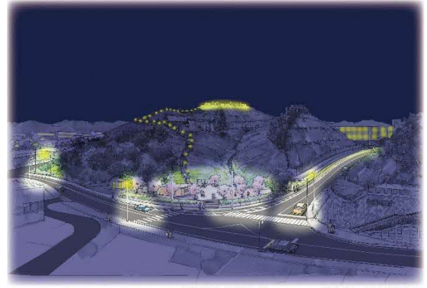
再整備イメージ図