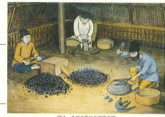
「千葉県の歴史 資料編考古4(遺跡・遺構・遺物)」 千葉県発行から引用

<加工段と土製支脚の解説図> 参考資料：シリーズ しまねの遺跡 発掘調査パンフレット5 「大田市久手町 市井深田遺跡」 2015年 島根県教育庁埋蔵文化財調査センター