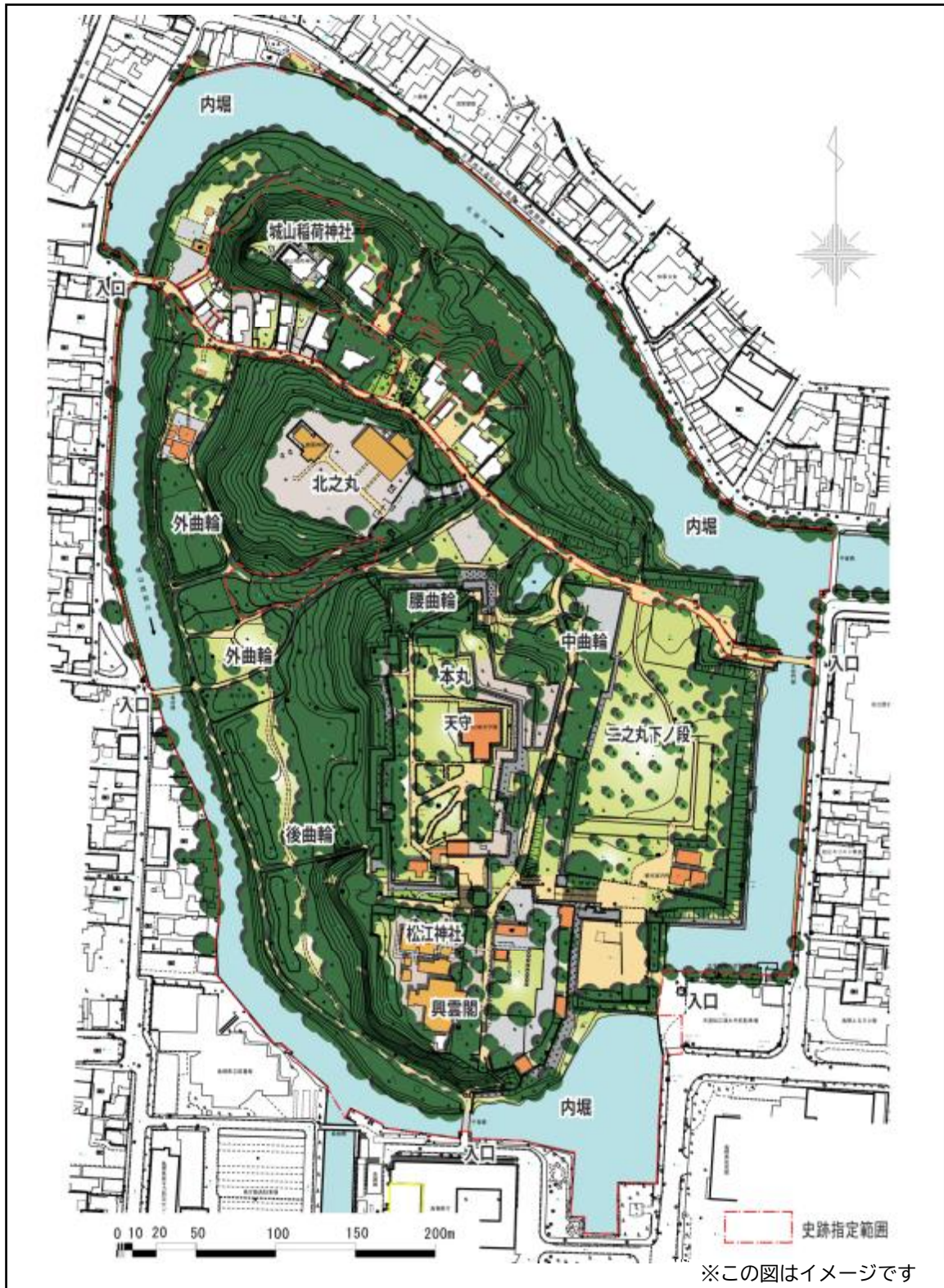
図7-2 史跡松江城整備基本計画図

これまでの検討結果に基づき、計画期間終了時における史跡松江城の再整備完成後の全体平面図および鳥観図を以下に示す。