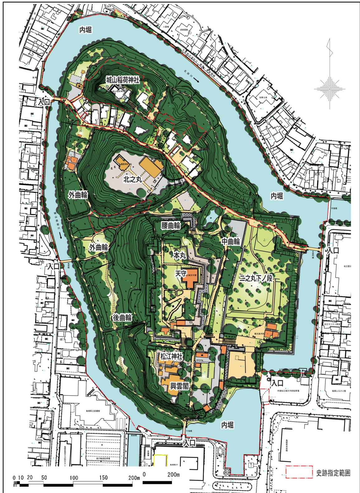
図7-2 史跡松江城整備基本計画図

これまでの検討結果に基づき、計画期間終了時における史跡松江城の再整備完成後の全体平面図及び鳥観図を以下に示す。