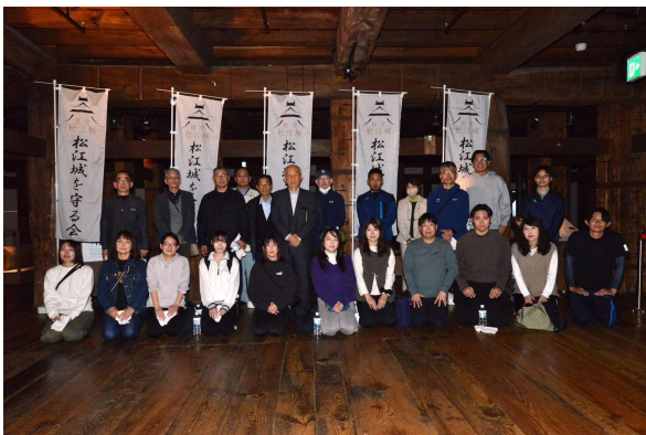
市民床磨き参加者の皆さん(3・4班)