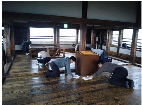
天守5階(市民床磨き)