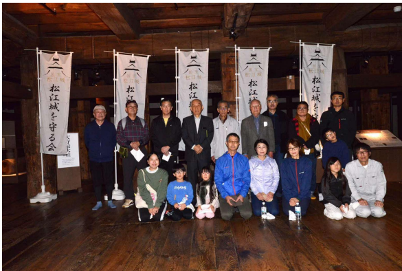
市民床磨き参加者の皆さん(1班)

来年以降も情報発信に努め、多くの市民の皆さまにご参加いただけるよう呼びかけていきたいと思います。