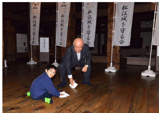
天守1階(市民床磨き)