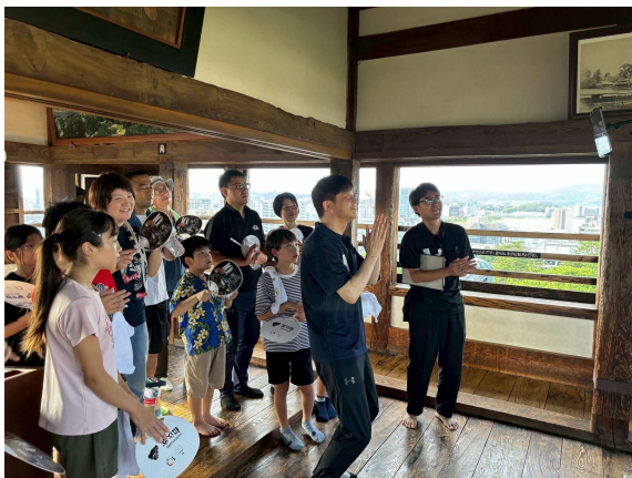
） オンライン中継の様子