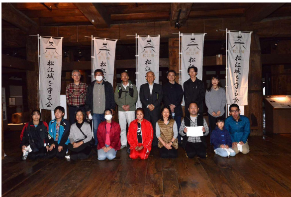
市民床磨き参加者の皆さん(2班)