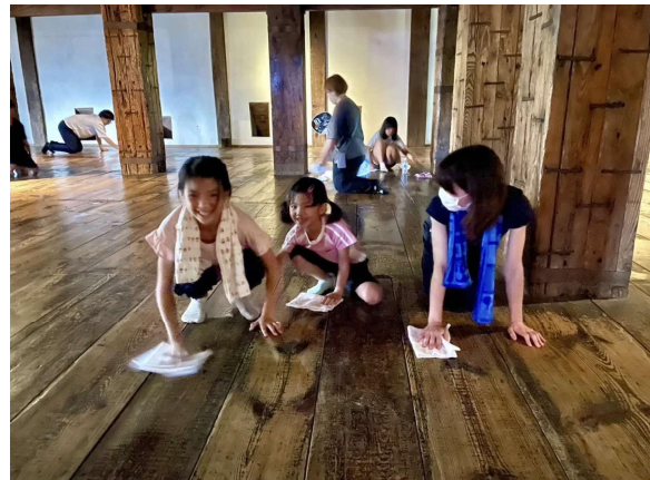
天守1階（五城合同床磨き）