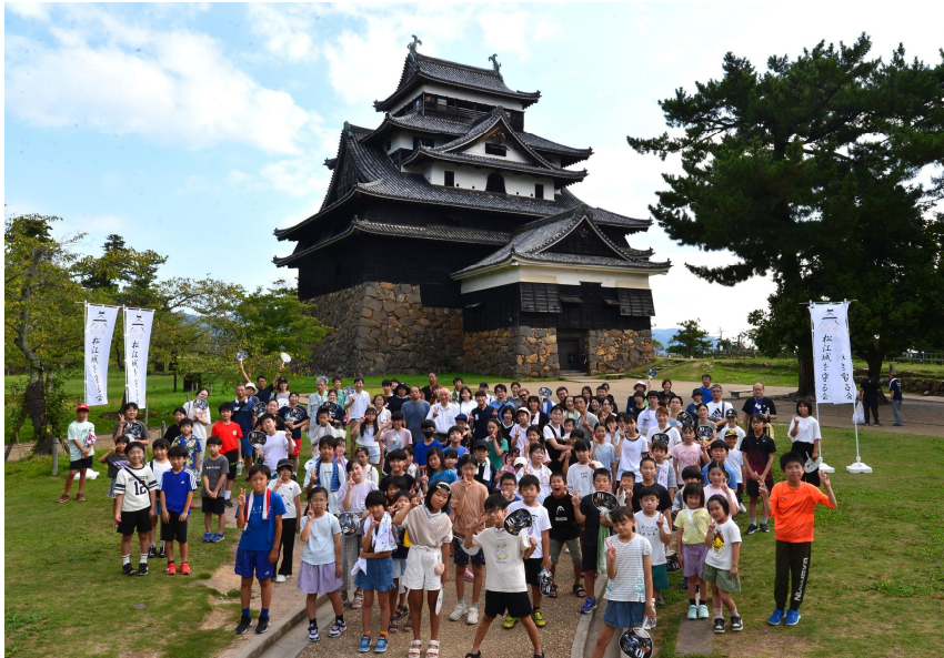
参加者の皆さんで記念撮影