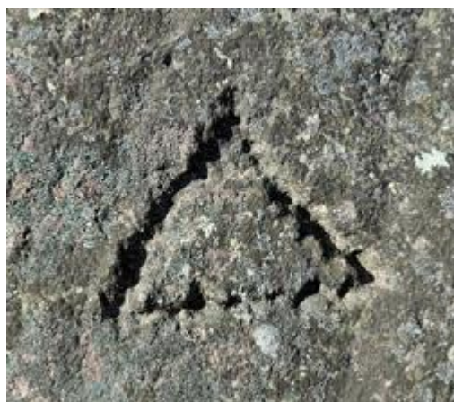
【図 1】 刻印「△（鱗）」

こうした刻印は松江城だけでなく、他の城郭の石垣でも見られます。刻印を記す意味は、城郭によっても異なりますが、天下普請で石垣を築いた城郭では、石垣普請に協力した大名が、それぞれ担当した持ち場の石垣に自分に由来する記号を付けたり、採石場で目印として付けられたものもあるとされています。松江城では、堀尾氏の下でそれぞれ石垣普請に携わった工人集団が記したものではないかと考えられています。