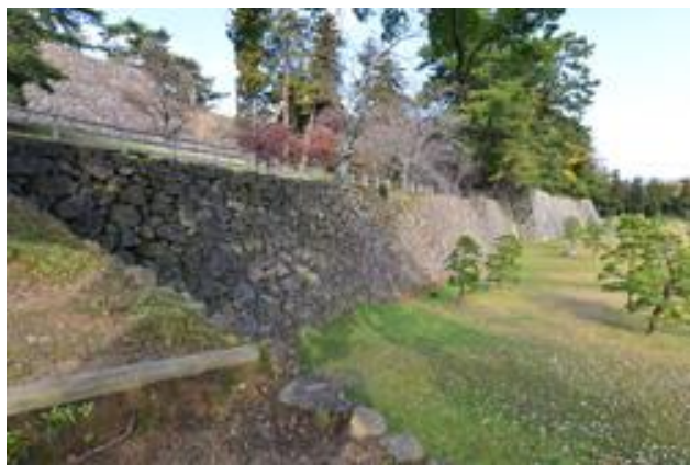
【図5】中曲輪東面石垣

こうした分布の傾向を見ると、全体としては城郭の中でも下段の曲輪で、かつ東に向いた石垣に集中する特徴が見られ、逆に本丸などの上段の曲輪や西側に向いた石垣には少ない傾向が見られます【図8】。