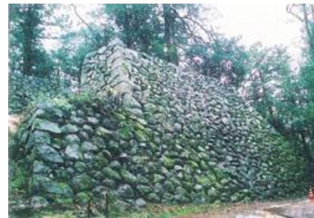
【図7】水之手門跡周辺石垣