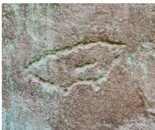
【図 2】 刻印「扇に一」