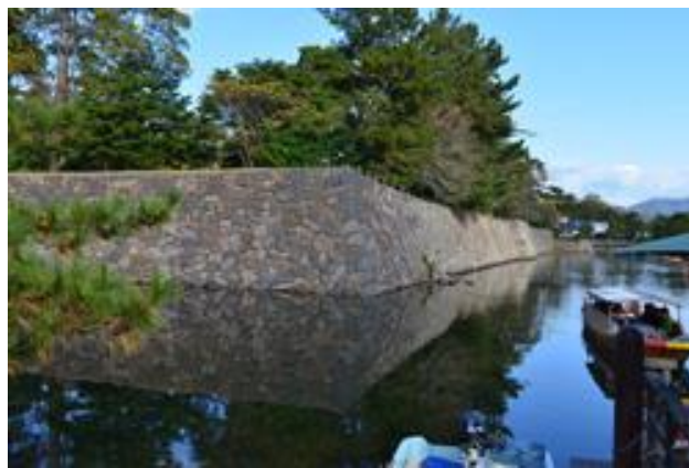
【図6】二之丸下ノ段堀石垣