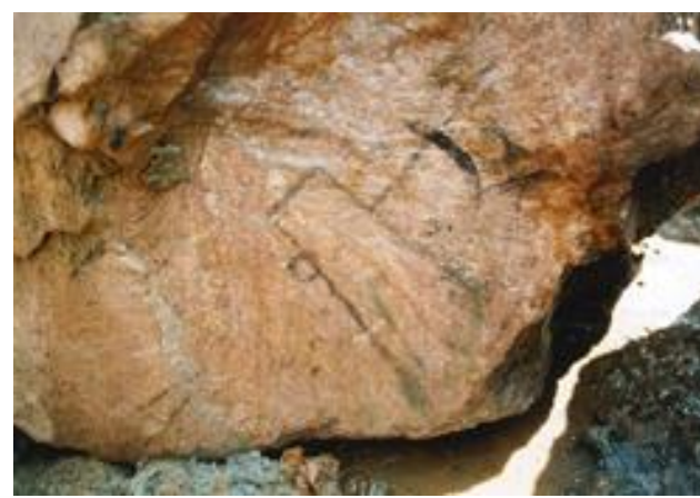
【図 3】 墨書「まさかり」