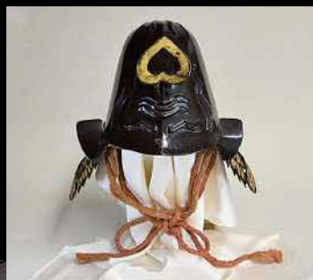
松江藩士の兜 / 江戸時代 / 館蔵