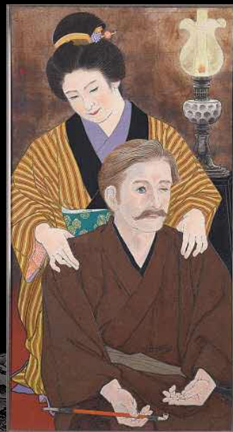
小泉八雲夫妻 / 和田悠成画 / 昭和50年 / 館蔵