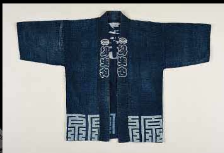
鴻生舎の法被 / 明治時代 / 個人蔵