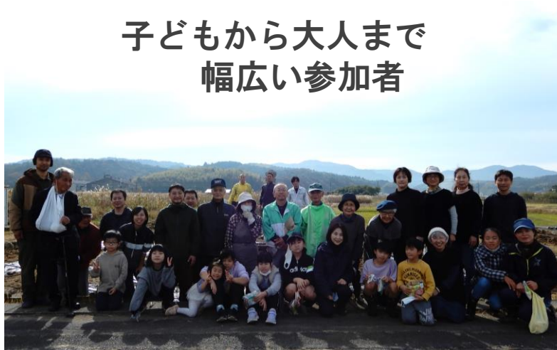
子どもから大人まで 幅広い参加者