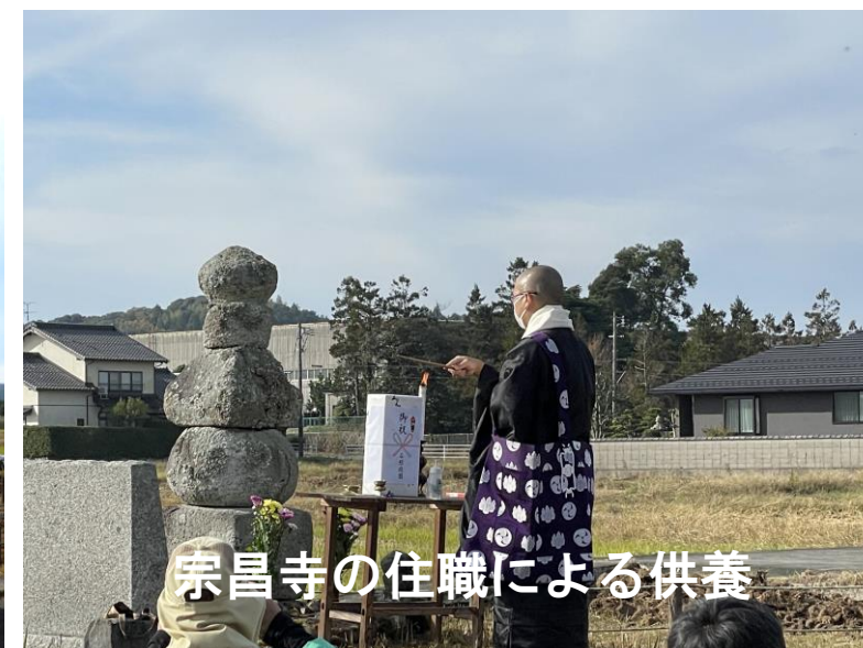
宗昌寺の住職による供養