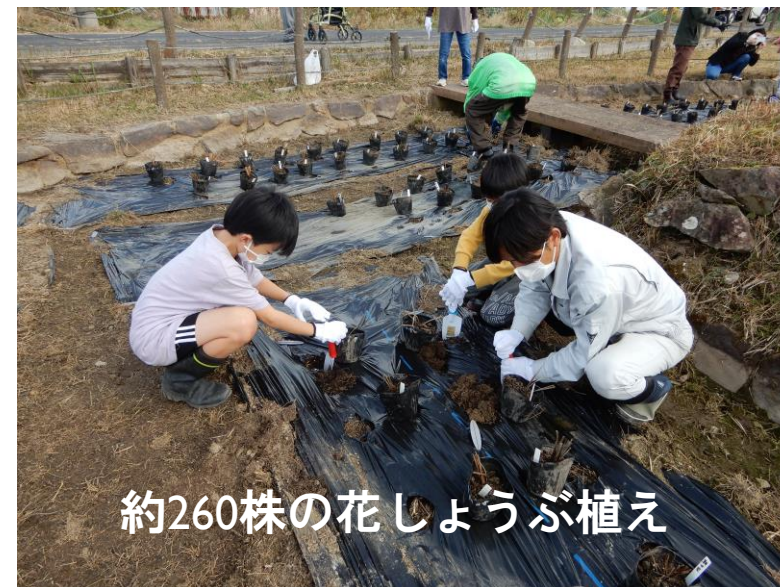
約260株の花しょうぶ植え