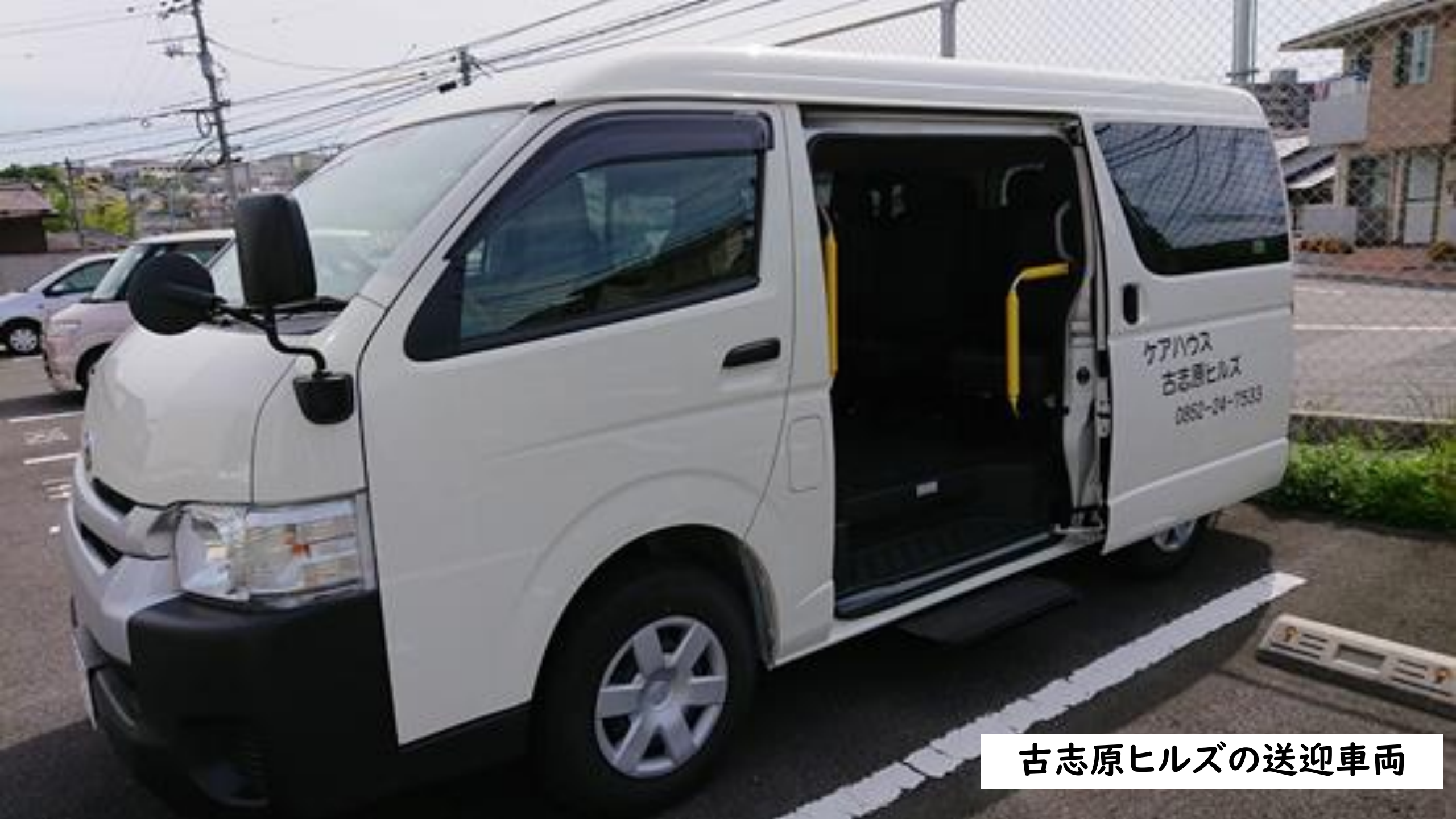
古志原ヒルズの送迎車両