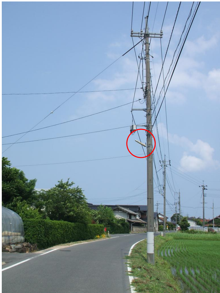
照らす道路が判るよう撮影します。