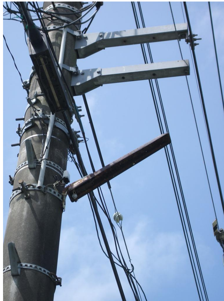
破損状況が判るよう防犯灯のアップ写真も撮影します。