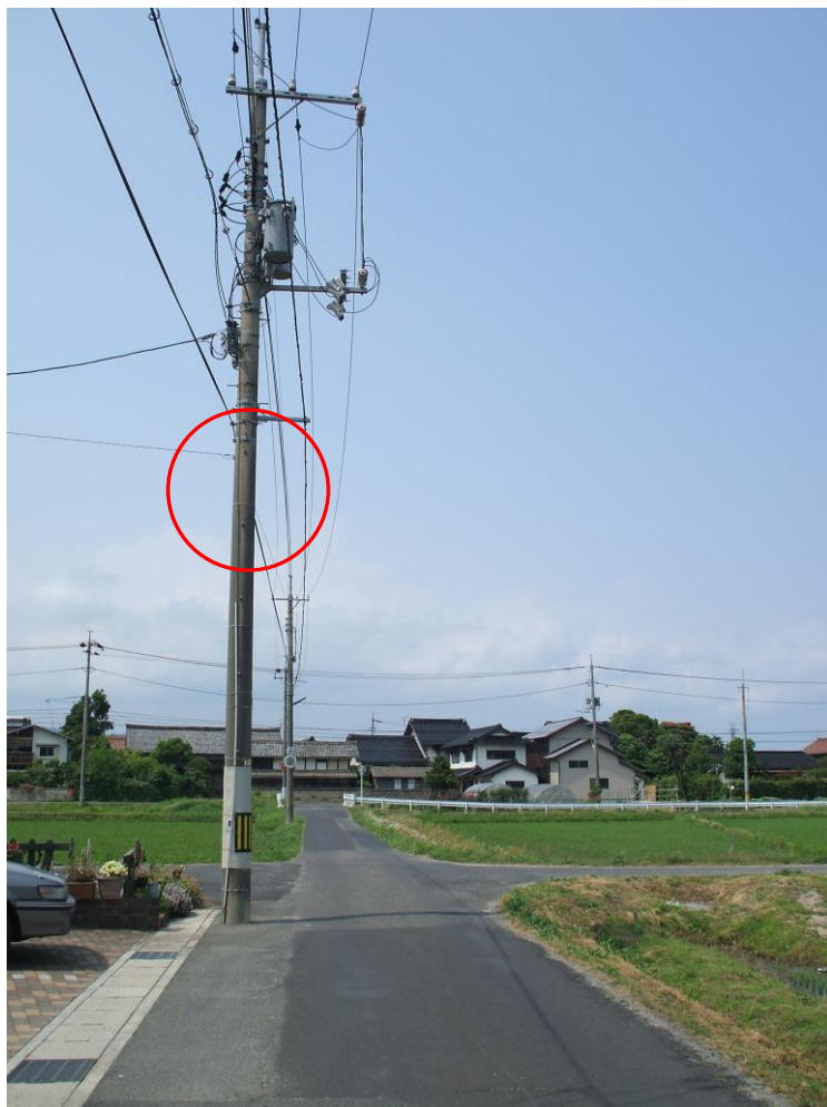
照らす道路が判るよう撮影します。