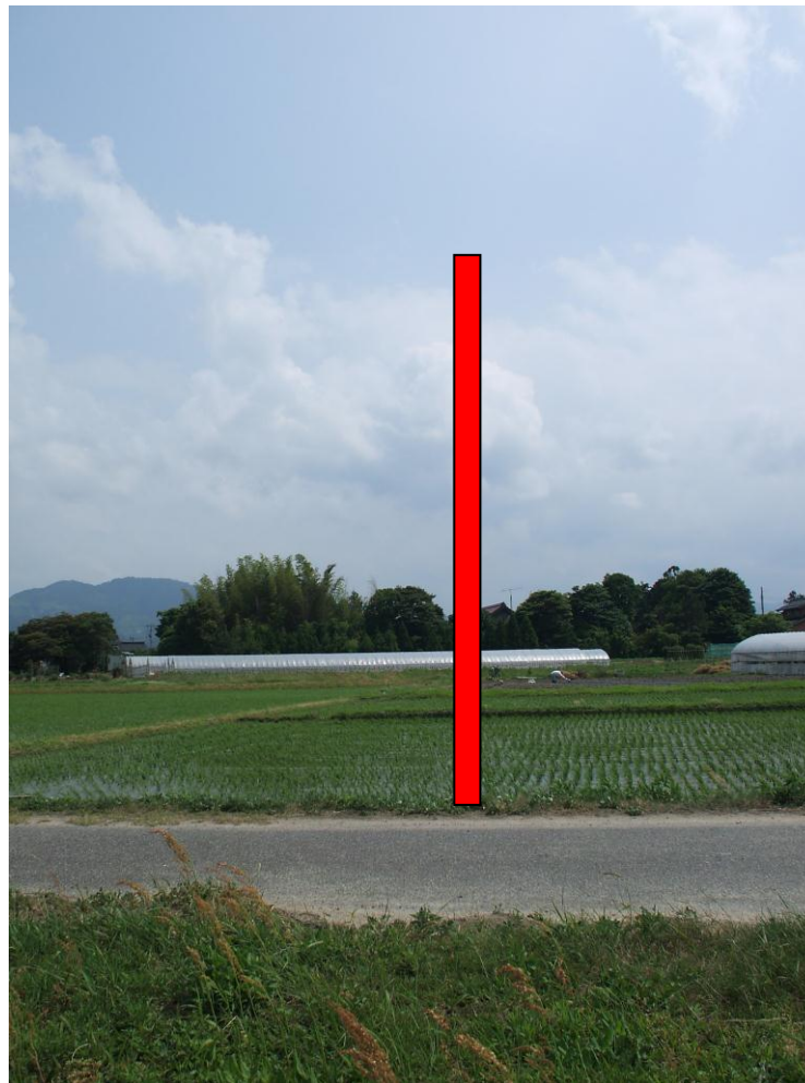
別のアングル（垂直方向）からも撮影します。