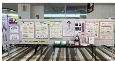
イオン松江ショッピングセンター