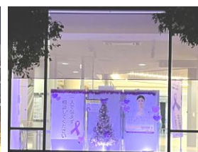
市民活動センター