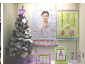
松江市立中央図書館