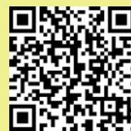
参加申込フォーム