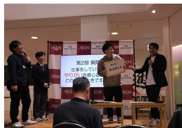
【介護ディスカッション】