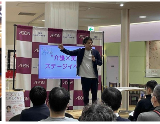
【介護×笑いのステージ】