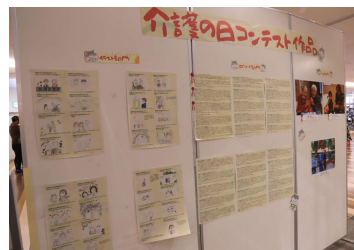
【介護の日コンテスト展示】