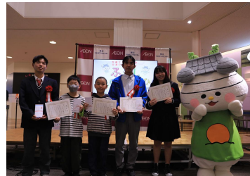
【介護の日コンテスト表彰式】