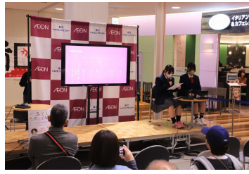
【高校生による学習の成果発表】