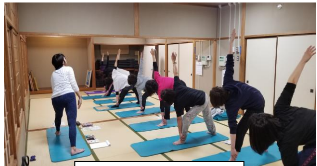
ヨガサークルの様子