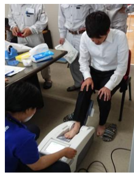
健康講座（応援団出前講座）の様子