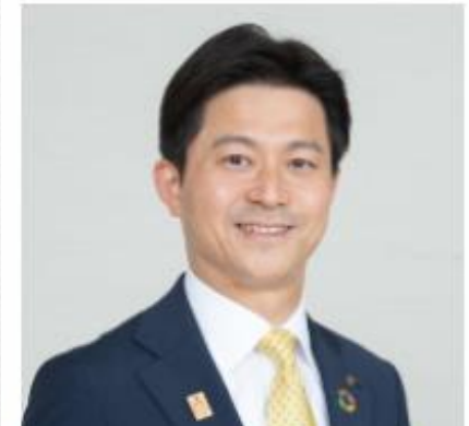
松江市長 上定 昭仁