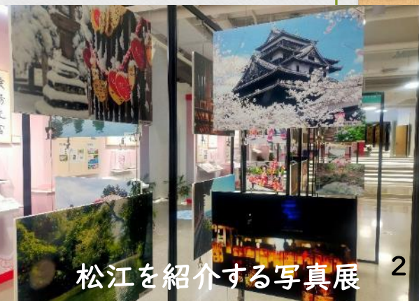
松江を紹介する写真展