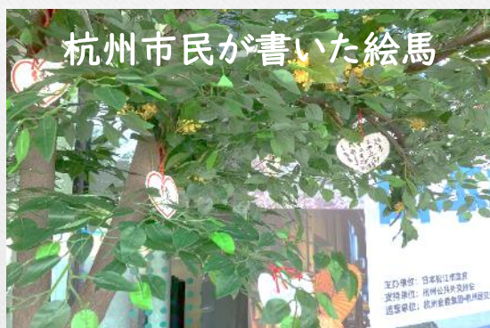
杭州市民が書いた絵馬