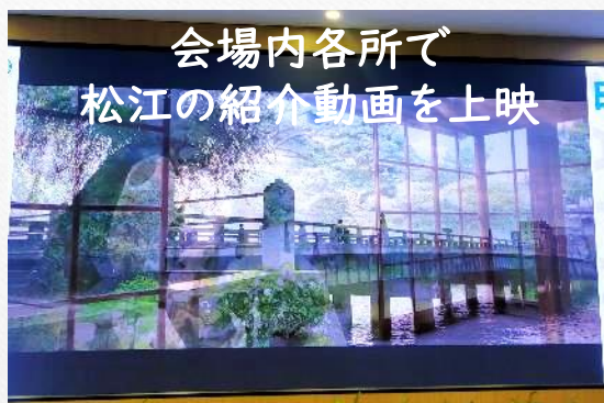
会場内各所で 松江の紹介動画を上映