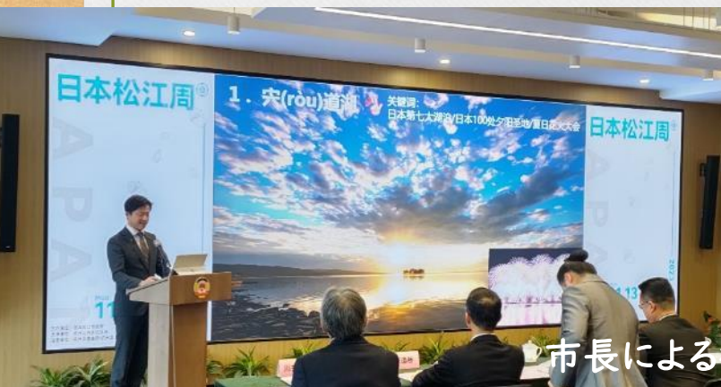
市長による観光セミナー